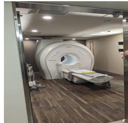
M R I