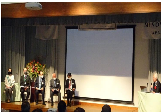
会員セミナー パネルディスカッション ウィズコロナ時代の「会員増強」と「公共イメージアップ」